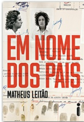
Em nome dos pais Matheus Leitão