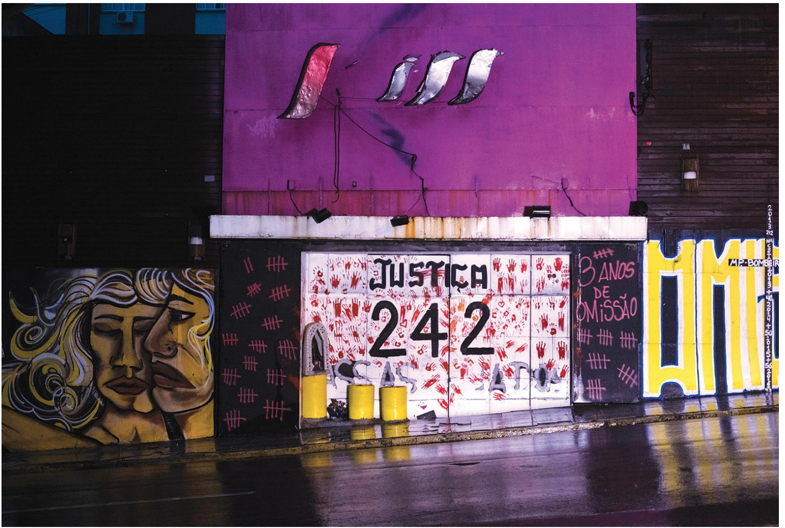
Protesto na porta da boate Kiss, onde um incêndio considerado o segundo maior do Brasil em número de óbitos acabou levando à morte 242 pessoas, a maioria por envenenamento.